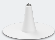
SAFETYPRO GREENSEC PLATFORMA