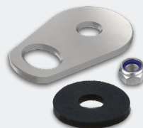
SET KONEKTORA I GLAVE SAFETYPRO