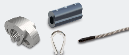
ACCESSOIRES DE FIXATION SAFETYPRO FIX