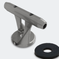
SUPPORT DE CÂBLE SAFETYPRO