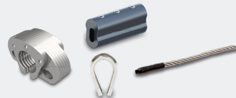
DODATNA OPREMA SAFETYPRO FIX