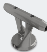
KOMPLET LINJSKEGA SIDRIŠČA SAFETYPRO